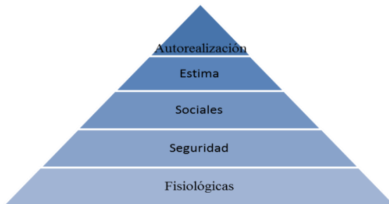
Figura 2: Jerarquía de las Necesidades de Maslow

enfocarse en satisfacer las necesidades de ese nivel o de los superiores, según el orden que se observa en la figura a continuación: