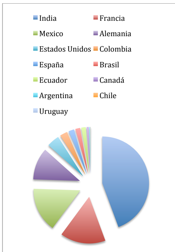
Gráfico 3: Remesas personales recibidas por país durante el año 2014