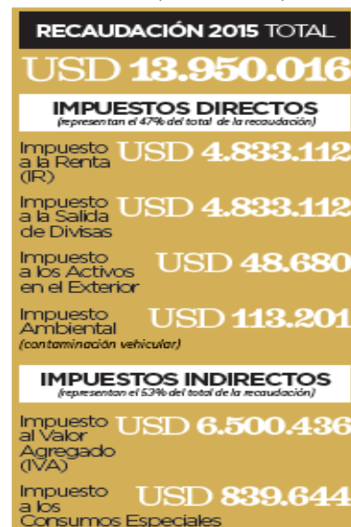
Figura 3. Recaudación fiscal 2015 de impuestos más importantes

Entrando en detalle se llega a pensar que la carga impositiva en Ecuador podría ser una de las motivaciones para el empresario en la búsqueda de paraísos fiscales evidenciando en los últimos años un importante aumento, citando un ejemplo se puede mencionar como bien afirman Quiroz (2016) y Yupa (2016) la recaudación de impuestos por parte del Servicio de Rentas Internas (SRI por sus siglas) cuyo crecimiento en el periodo del 2007 – 2015 pasó de $5361,8 millones a $13 950 millones lo cual es el resultado del incremento de tarifas y la creación de 16 impuestos en los últimos 10 años, etc. (SRI, 2016b)