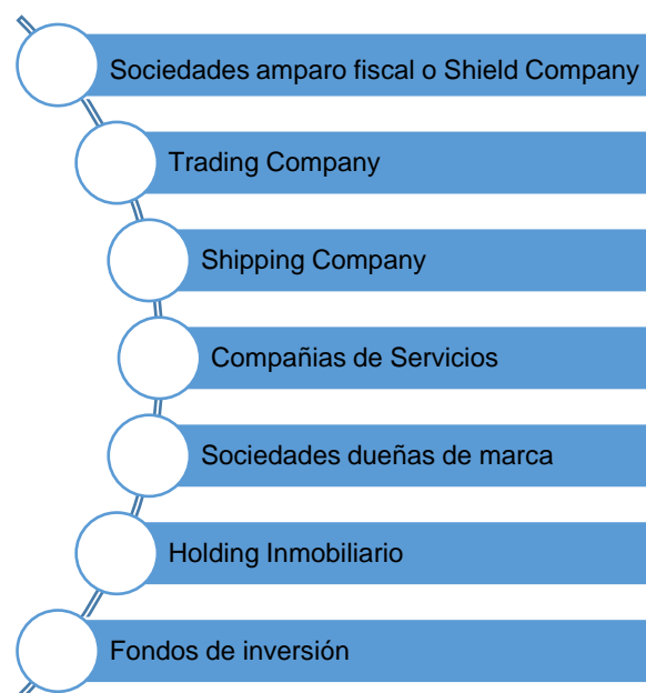
Figura 1 Modelos sociedades offshore

Establecidos anteriormente los diferentes motivos que conllevan a la creación de sociedades offshore sin necesidad de recurrir a malas prácticas en su uso, se han desarrollado varios modelos de sociedades en la actualidad y cuya utilización responden diversas necesidades surgidas por parte de los inversores.