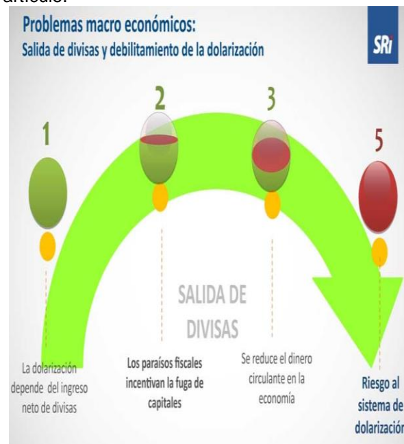
Figura 5. Sectores productivos que más transfieren divisas.

De este modo para ilustrar, los sectores económicos que más transfieren divisas a paraísos fiscales (Figura 5) son el sector importador, las entidades financieras y los depósitos en cuentas en el exterior quienes encabezan el Top de la lista. Mientras que las operaciones con tarjetas de crédito o débito se ubican en los últimos lugares, dando a notar que, si es por operaciones financieras internacionales, conviene utilizar por parte de los inversores la banca offshore por los beneficios que otorga antes mencionados en este artículo.