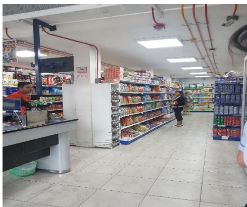
Gráfico 3. Área de comercialización en perchas.

bodega se almacenan productos de limpieza y de aseo personal, en cambio en las perchas están separados lo que dificulta que los responsables del cuidado de este sector de inventarios no pueden ejercer un buen desempeño de su custodia.