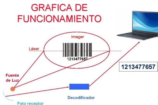
Gráfico 1. Funcionamiento del Código de Barras.