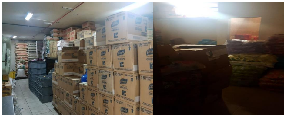
Gráfico 3. Área de bodega.

Los inventarios se codifican automáticamente al realizar sus ingresos pero no son clasificados de acuerdo a su forma de almacenamiento sino de manera aleatoria usando una sola bodega automatizada como referencia en el sistema de control, lo que dificulta poder identificar los productos que se encuentran en las bodegas y los que están en perchas para poder cuantificar el valor real de las existencias.