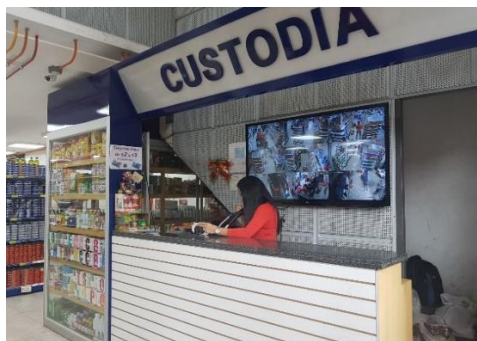
Gráfico 4. Área de Custodia.

El personal que opera tanto en ventas como en custodio de mercaderías (perchas y bodega) tienen la responsabilidad de cuidar los inventarios, a tal punto que durante el año 2014, 2015 y 2016, las pérdidas ejercidas, afectaron sus utilidades al formar las pérdidas ocasionadas parte del coste general de gastos en un valor realmente excesivo al que debería existir. Esto se debe a que durante los despachos de mercadería, se han producido pérdidas ya sea por la mala manipulación o por la mala administración de las fechas de caducidad.