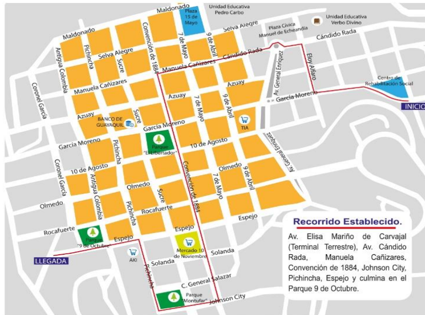
Ilustración 1. Recorrido del Carnaval de Guaranda

proclamación al Taita carnaval, comparsas carnavaleras, entierro del carnaval (Gobierno Autónomo Descentralizado de Guaranda, 2018).