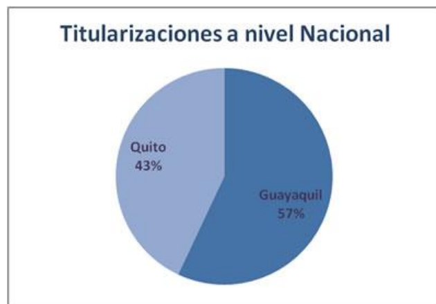
Figura # 2. Emisión de Titularizaciones BVQ y BVG Nota. De "PODERES" - Inteligencia Política, 2012

En la figura # 1, (Fiducia S.A. Administradora de Fideicomisos, 2003) explica quienes intervienen en un proceso de Titularización, el cual, inicia con el propietario (originador) quien transfiere los activo a titularizar a una administradora de fondos y fideicomisos (agente de manejo),su inversión es controlada por un fiduciario; quien responde por el patrimonio tanto del originador como del inversionista, de acuerdo a un contrato de constitución del fideicomiso aprobado por el registro de mercado de valores y se da a conocer mediante las compras públicas.